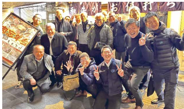
楽しかったー!の集合写真