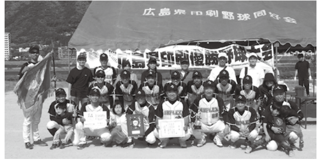
準優勝の(株)アドプレックスチーム

Aグラウンドの2試合目は、金陽社と中本本店が対戦、金陽社は3回に5点、4回に7点と12対0とコールド