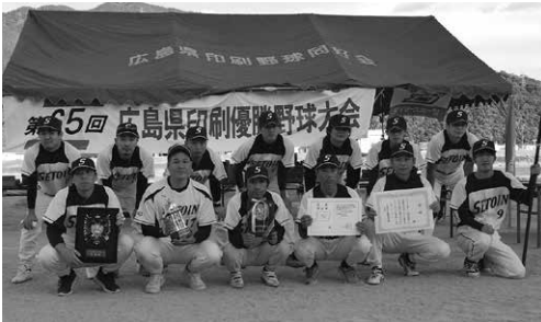
準優勝の瀬戸内海印刷(株)チーム