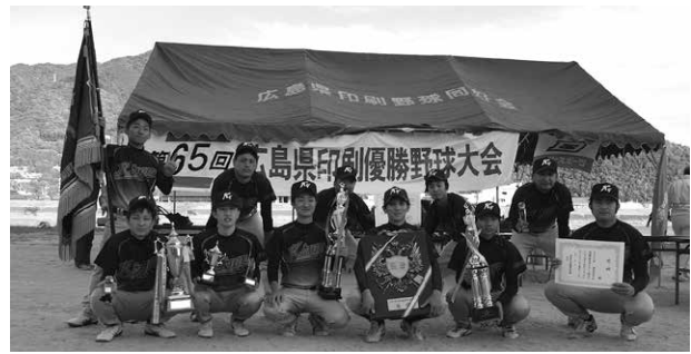
優勝の(株)金陽社チーム

A グラウンドの 2 試合目は、(株)中本本店（以下本店と省略）とイケダ(株)（以下イケダと省略）が対戦、1 回裏イケダが 1 点先制、その後も小刻みに追加点。本店は 5 回まで 0 行進、守りにもわか練習がひびき体の痛みが取れず、5 回裏に 3 点取られコールド負けに終わった。イケダは準決勝進出。