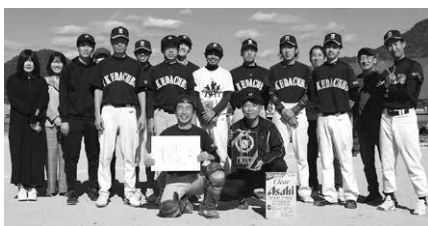
3 位のイケダ(株)チーム