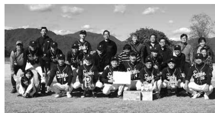
3 位の(株)アドプレックスチーム