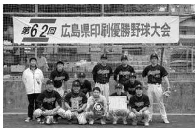
3位の(株)インパルスコーポレーションチーム