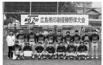
3位の(株)金陽社チーム