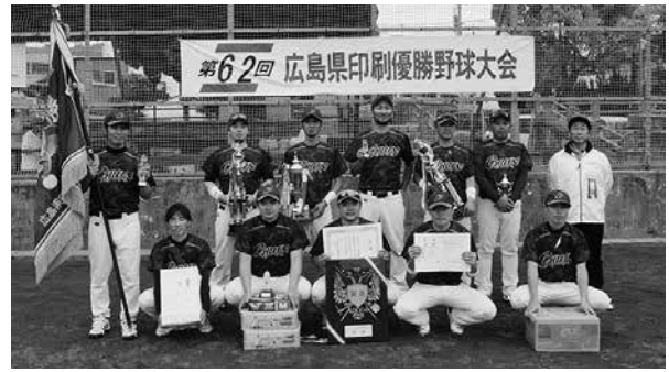
優勝の中国印刷(株)チーム

ります。まず水分をしっかり取って体調管理をしていただいで、楽しい大会にさせていただければと思います。今日は野球を通じて親交を深め、日ごろの練習の成果を発揮していただきたいと思います。皆さん頑張ってください」と激励の挨拶を述べた。