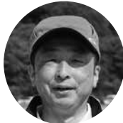
花田大会運営委員長

1 日目は好天の五月晴れ、午前 9 時に参加チームの選手が整列、開会式が挙行され、花田大会運営委員長が、「この晴天のもとで令和時代幕開けの野球大会ができることを幸せに思っております。昭和・