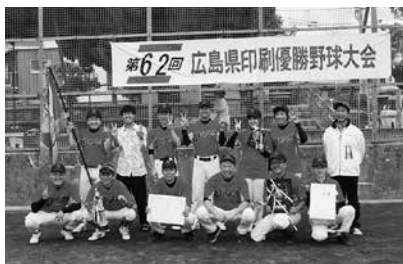
準優勝の広島洋紙(株)チーム