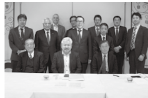
経営革新マーケティング