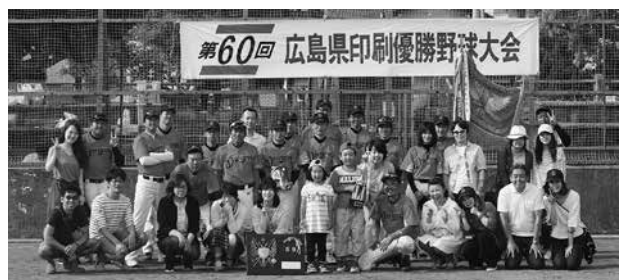
準優勝の広島洋紙(株)の皆さん