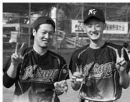
最優秀選手賞・最高殊勲賞