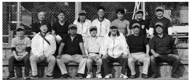
いつも大変なお世話をさせていただいている役員の皆さん